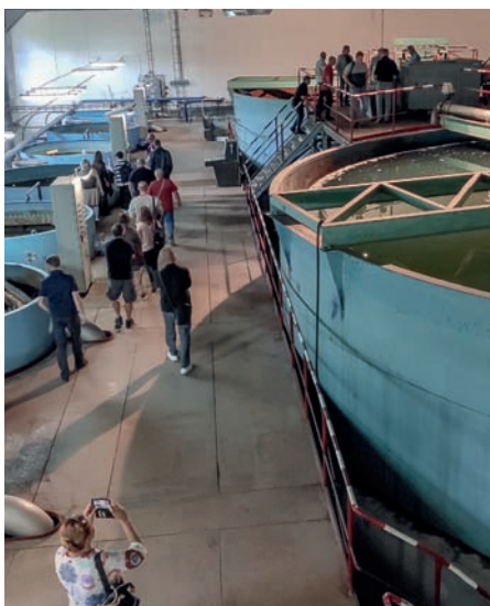
Úpravna vod v Příbrami.

Vodovodní přivaděč je součástí budoucího skupinového vodovodu, který zajistí v budoucích letech plynulé zásobování pitnou vodou všech spotřebičů v lokalitě Dobříšska a Novoknínska zahrnutých do připravované stavby. V současné době je ve většině obcí zásobování pitnou vodou řešeno individuálně nebo z místních vodovodů pro veřejnou potřebu, které využívají lokální podzemní vodní zdroje, jež jsou z dlouhodobého hlediska zdroje zranitelné a nestabilní. Skupinový vodovod je navržen na základě zpracované studie potřeb jednotlivých obcí v této lokalitě, dle stavu stávajících vodních zdrojů a výhledových potřeb objemu pitné vody.