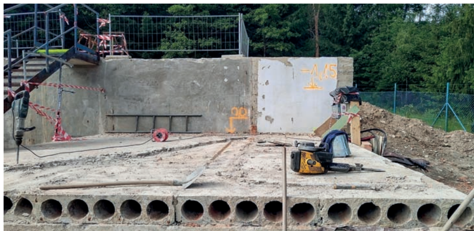
Rekonstrukce vodojemu Trnová.

Vodohospodářská společnost Dobříš, spol. s r. o., v současnosti pracuje na zásadním projektu, který zlepší dostupnost kvalitní pitné vody v regionu. Vodovodní přivaděč o délce cca 50 km propojí skupinový vodovod Příbramsko s oblastí Dobříšska a Novoknínska. Stavba je jedním z řešení, jak se vypořádat s dopady klimatických změn a častějšími obdobími sucha.