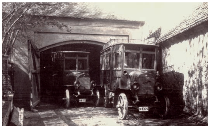
Konečná stanice a garáž Nový Knín v roce 1926