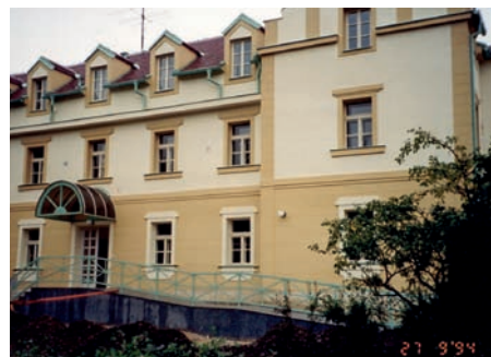
Dům s pečovatelskou službou v roce 1994