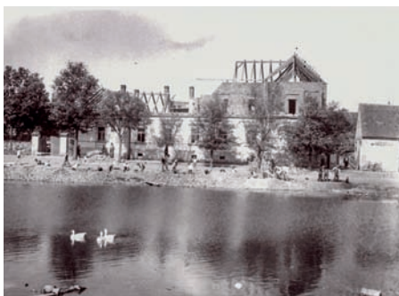
Přístavba patra chudobince na snímku ze dne 5. září 1936