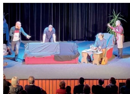
Představení spolku Pípa platí – Blbec k večeri