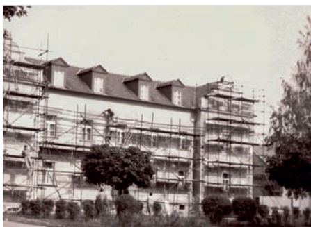
Rekonstrukce domu čp. 443 na fotce ze září 1990