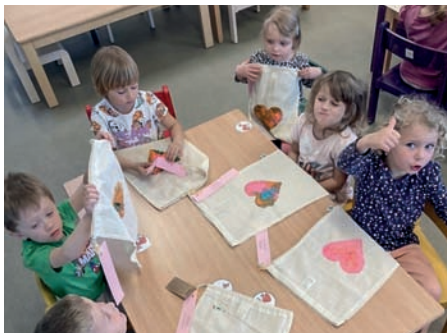
Dárečky pro maminky