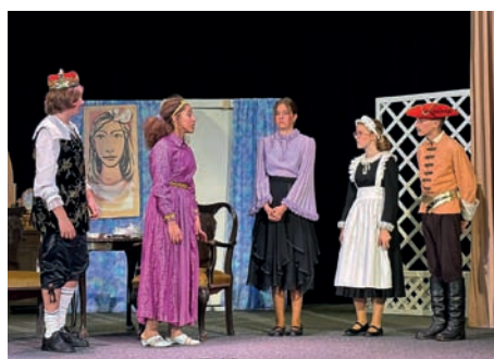
Dětské představení – O Rohaté princezně