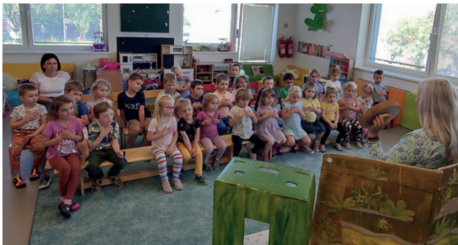
Knihadýlko ve školce