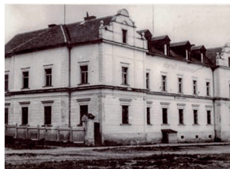
Městský chudobinec s již zasypáním rybníčkem na fotografii z června 1944