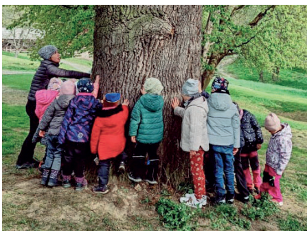
Čerpáme energii z přírody