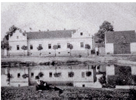
Chudobinec i s rybníčkem Permánkem někdy kolem roku 1912 na nepříliš kvalitním snímku