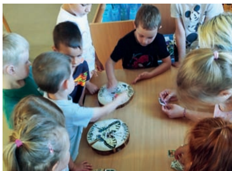
Projekt My se školy nebojíme