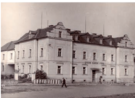
Dům čp. 443 jako okresní národní výbor v roce 1959