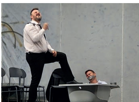
Představení spolku KLAS – Krysa